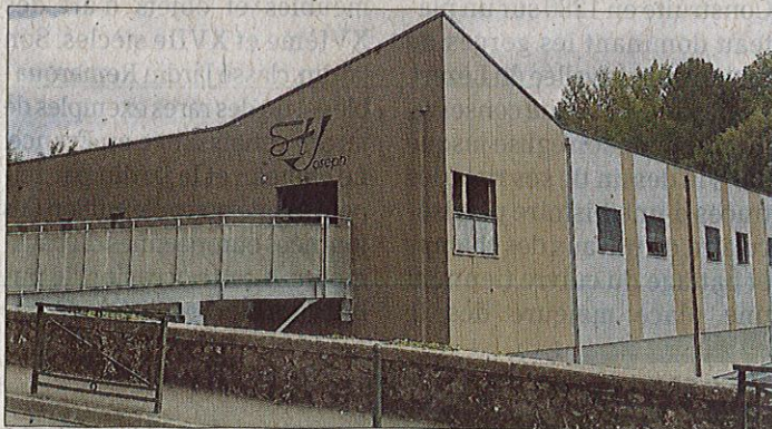
Si l'internat a accueilli ses premiers élèves l'année passée, le gymnase sera opérationnel dans le courant de l'année.

* Les résultats aux différentes épreuves l'année passée : 100 % de réussite au Bac général et à la Mention complémentaire Cuisinier en desserts de restaurant, 98,8 % au Brevet et 89,5 % au bac pro.