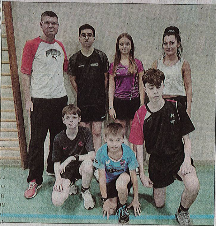
Les entraînements ont déjà commencé au sein du Ping Académie Villefrancois.

TENNIS DE TABLE. Depuis la semaine dernière, sept jeunes pongistes ont intégré le tout nouveau pôle de tennis de table créé au sein de l'ensemble scolaire Saint-Joseph. Avec l'objectif de progresser, tout en se faisant plaisir.